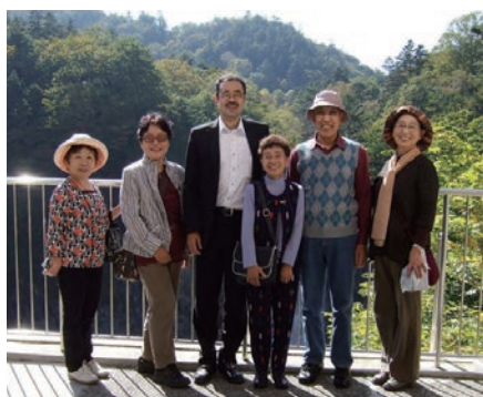
滝を見下ろす観瀑台で記念撮影