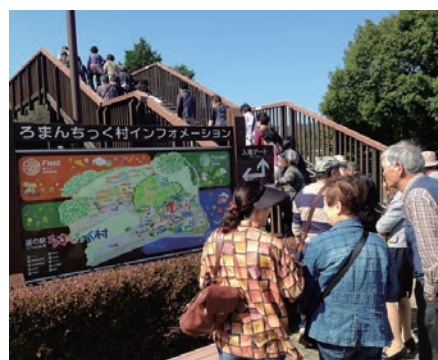
道の駅うつのみや・ろまんちっく村

最初の訪問地は、道の駅うつのみや・ろまんちっく村。東京ドーム10個分の敷地内に農産物直売所、体験農場、温泉・