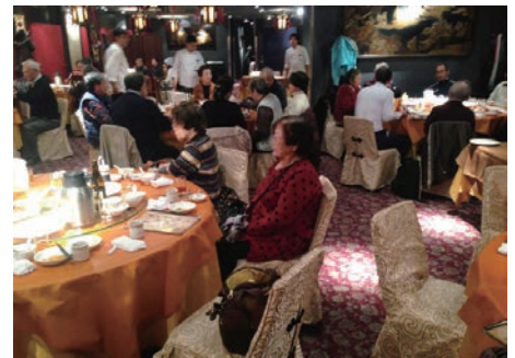
横浜中華街でバイキング

25日は日本共産党志茂・赤羽後援会主催の初詣日帰りバス旅行に参加。今回は、川崎大師に参拝した後、横浜中華街で食事という大人気のコース。午前8時、バス2台、65人で赤羽を出発しました。車内であいさつ、自己紹介などするうち、ほどなく川崎大師に着。1月下旬といえど初詣の名所、餠切りの音が鳴り響く仲見世には参拝客がごった返していました。参加をすませ、横浜中華街へ移動。名店大珍樓の宴会場を借り切って、中華バイキングの始まりです。定番の北京ダック、フカヒレスープ、エビチリから宮廷料理のアヒルの燻製、デザートは杏仁豆腐まで、これでもかというくらい料理を平らげ、胃袋も心も大満足でした。最後に寄った生麦のキリンビール工場では、一番搾りのビールを試飲。快晴で渋滞もなく最高のバス旅行となりました。(のの山けん)