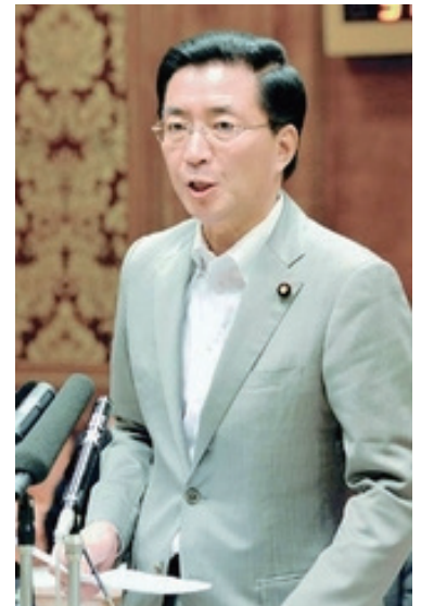
質問する山下芳生書記局長 =24日、参院予算委員会

れなかったこと、「反省」と「お詫び」も歴代政権による表明を記載するのみであることを指摘して、安倍首相自身の歴史認識を質しました。