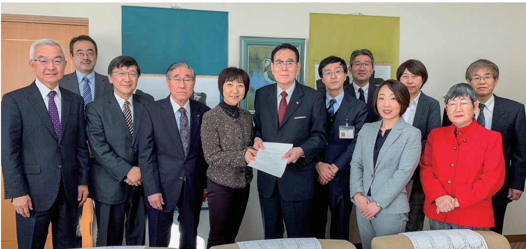
花川区長に学校整備についての緊急提言を手渡す日本共産党北区議員団 = 18日、北区役所

日本共産党北区議員団は、18日、人口増に対応した学校整備を求める緊急提言「子どもたちにゆとりのある教室と豊かな教育環境を」を発表し、同日、北区の花川区長と清正