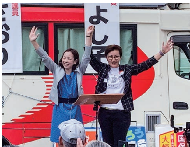
声援にこたえる吉良参院議員(左)と池内前衆院議員

8日、赤羽駅東口で、希望と安心の政治をめざす「日本共産党リレートーク」が開かれました。 都内の大学に通う学生は、高い授業料を払うために学業そっちのけでアルバイトに奔走する学生の実態を告発、「みんなで選挙@東京12区」の代表は、市民と野党の共闘でこそ政治は変えられると強