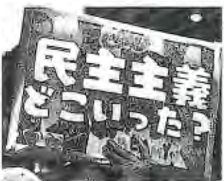
「LOVE&PEAC E PARADE」参加者のフラカード

た。長崎大学に通っていたとき、77年前の原爆の惨事を感じることが日常生活でよくありました。そして、あの時の原爆よりも威力の強い核兵器と一緒にまだ私たちは生活をしていると考えると、真剣に向き合わないといけない問題だと思ったからです。