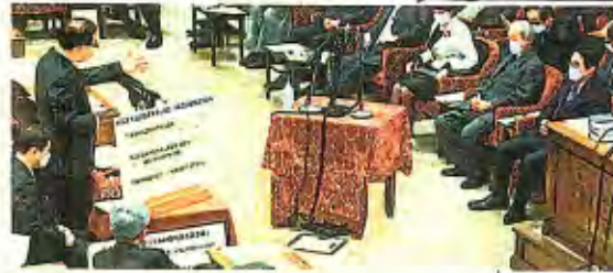
質問する志位和夫委員長 (左)=31日、衆院予算委

「安保3文書」に盛り込まれたのが、敵基地攻撃とミサイル防衛を一体化させた米戦略がIAMDだ。 ⇒統合防空ミサイル防衛