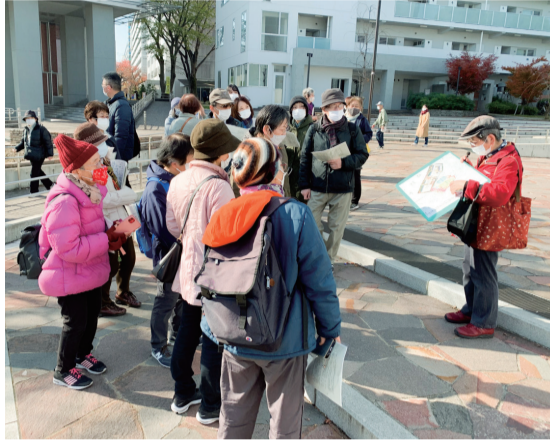
よりよい児童相談所の建設を求める区民のみなさんが、児相等複合施設建設地を現地視察。区議団も参加しました。=2021年12月11日

事情を抱える子どもや家族に十分な配慮が必要とされる北区児童相談所が、子ども家庭支援センター、児童発達支援センター、教育総合相談センターとの複合施設として旧赤羽台東小学校跡地に建設予定です。ところが隣地には学校跡地の半分とUR用地の一体的活用で約300戸の民間分譲マンションが誘致されることが明らかとなり、プライバシーや風害など周辺環境に対する懸念が寄せられています。党区議団は、教育委員会が住民の声に真摯に耳を傾け、子どもたちに最良の環境を保障する計画とするよう教育長に要請しました。